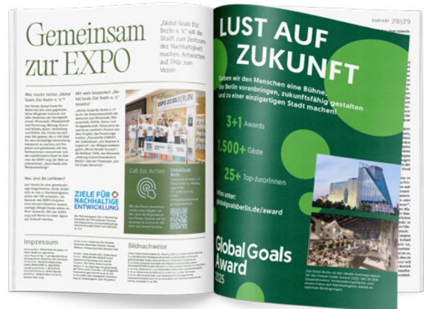
Ansicht Innenseiten | Ausgabe Nr. 3, Oktober 2024