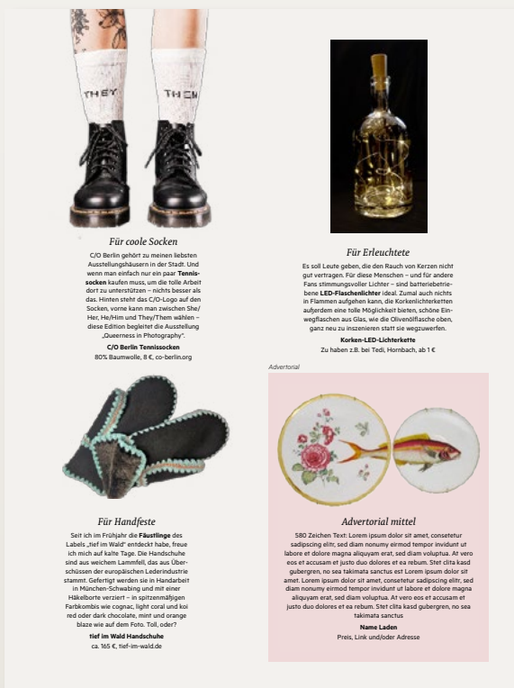
Advertorial mittel 84 × 110 mm